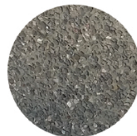
Bardage gravillonné lavé